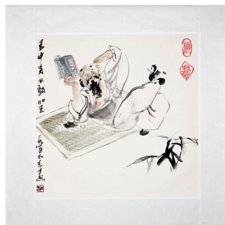
oeuvre de Gu Chun

ISBN 978-2-84273-987-4 Livre relié à la chinoise 72 p.couleur, 21,5 X 21,5 cm 30 €