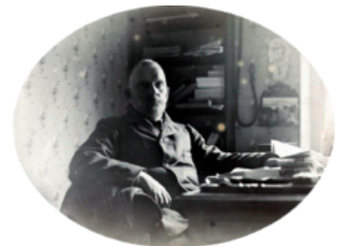
Jules Renard