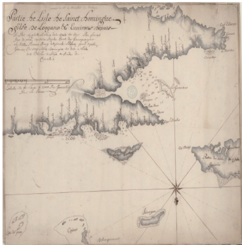
Plan de l'île de St Domingue