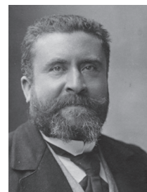
Jean Jaurès, L'humanité, 27 juillet 1914

« L'irréparable n' a pas été encore commis, et tant que l'irréparable n'est pas accompli (...), on peut espérer que par un suprême effort de sagesse les gouvernants à quelle horrible catastrophe le monde serait conduit (...) »